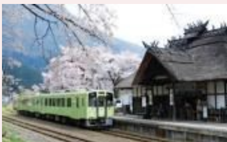
☆温泉旅行にでも行きたいですね～

そして、やはり一番の癒しであり贅沢と言え、温泉でゆっくり過ごせることでしょうか(笑) そして、今年は何か新しいことをはじめようと考えています。 春になったら運動を始めようかと……(汗) 何をするかは決めてはいませんが、身体を動かす事を何かしたい気持ちです。 毎年思っていたのですが、あれこれ考えているうちに一年が過ぎていったので、今年こそは!! と思いを新たにしています。