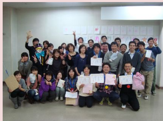
昨年の様子（スリッパピンポン大会）