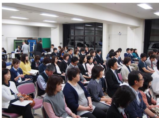
たくさんの方が参加して下さいました。