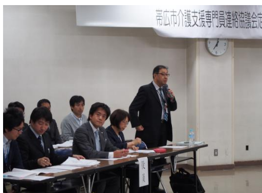
笠松会長の挨拶です。

今年の定期総会も平日19時からの開催でしたが、多くの会員の皆様にご参加頂き、昨年度の活動報告と決算が承認され、今年度の事業計画・予算を審議決定し、新役員を選出しました。また、今年度の総務・研修部員の紹介も行いました。