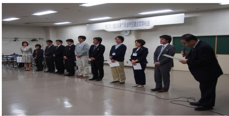
笠松会長から今年度の役員紹介をして頂きました。